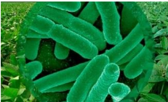
Cepas amplificadas de la bacteria Azospirillum

Algunas compañías en diferentes países han registrado inoculantes de Azospirillum para maíz y para algunos otros cultivos. Aun cuando el uso de Azospirillum como un buen bioestimulante del crecimiento de las plantas no se ha generalizado mundialmente, en México la aplicación de esta bacteria en diferentes cultivos ha superado con mucho lo alcanzado