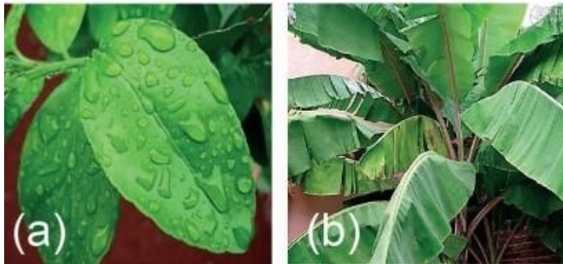
Figura 1. a) Hojas de limón b) Hojas de plátano.

Para que el análisis foliar constituya una herramienta útil en el diagnóstico nutricional de los cultivos, es fundamental efectuar un buen muestreo. El laboratorio puede entregar unos resultados de una calidad química excelente, pero la validez agronómica del análisis depende fundamentalmente del muestreo que se efectuó.