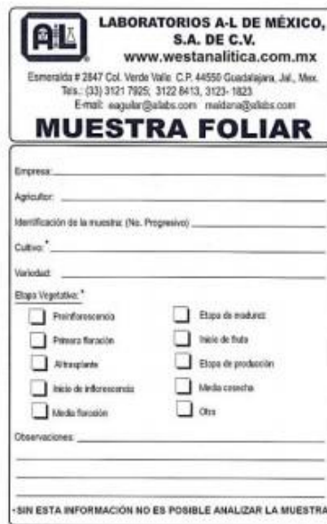
Figura 3. Bolsa de Laboratorios A-L de México para la recolección de muestra de planta para el análisis foliar.